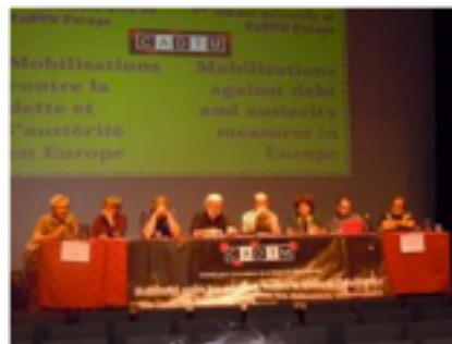
Foto: Sesión Apertura II Escuela de Verano CADTM 2011