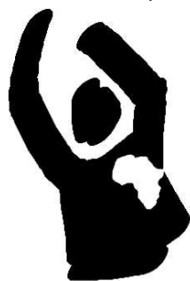
Un autre sommet pour l'Afrique

Le reste du sommet a permis de dénoncer la privatisation des services et les négociations secrètes de l'AGCS au sein de l'OMC, de demander un engagement réel des Etats au moment du prochain G8 concernant leur participation au fonds mondial de lutte contre le SIDA, de réclamer plus de transparence dans les relations entre les multinationales et les Etats afin d'éviter le pillage de l'Afrique, d'exiger