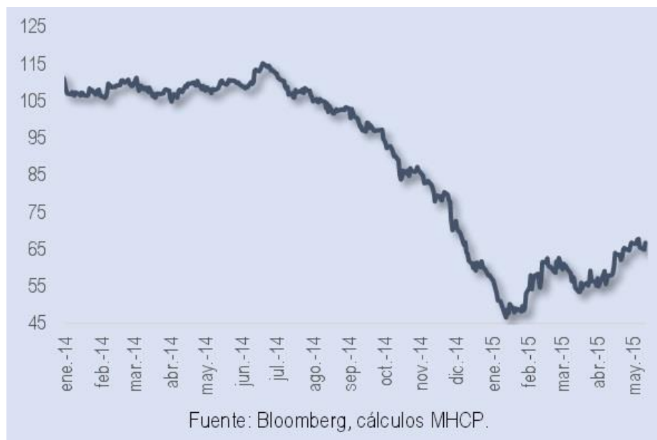
Gráfica No. 2 Evolución del Precio del Petróleo en dólares 6

una reducción de los ingresos de la nación aproximadamente en 20 billones de pesos, es decir el 10% del PGN. Este efecto en la economía colombiana conlleva a una devaluación de su moneda que ronda un 40% con relación al dólar, provocando un aumento de reflejo entre la deuda pública y la devaluación del dólar; es decir que la Deuda Publica puesta en dólares ha aumentado en el último año aproximadamente un 40%.